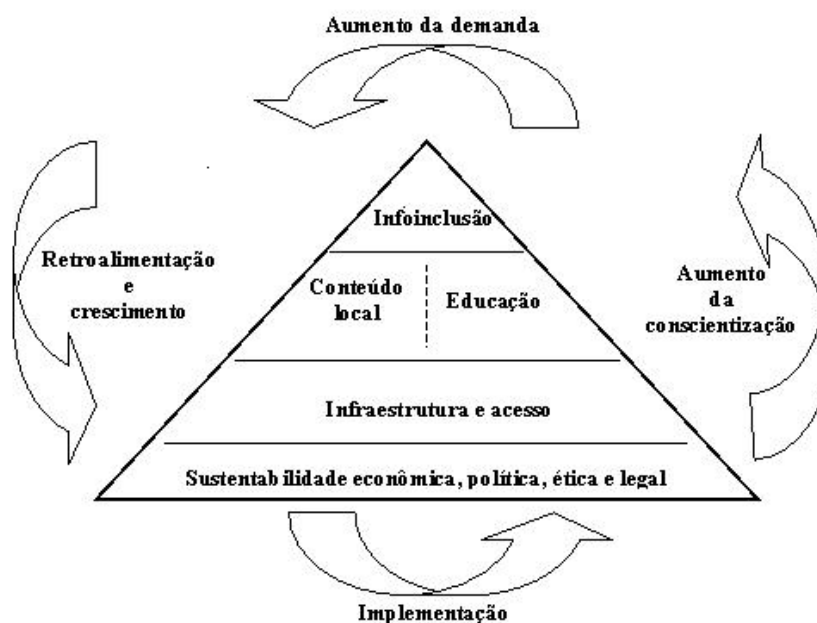
Figura 1: Modelo Heurístico de Infoinclusão Dinâmica (2iD)

O modelo heurístico de infoinclusão dinâmica (2iD, ver figura 1) foi proposto por Joia (2004) com base no modelo desenvolvido por Afonso (Afonso, 2000). O 2iD se coaduna com as demandas anteriormente expostas por um modelo de inclusão digital mais dinâmico, holístico e sistêmico.